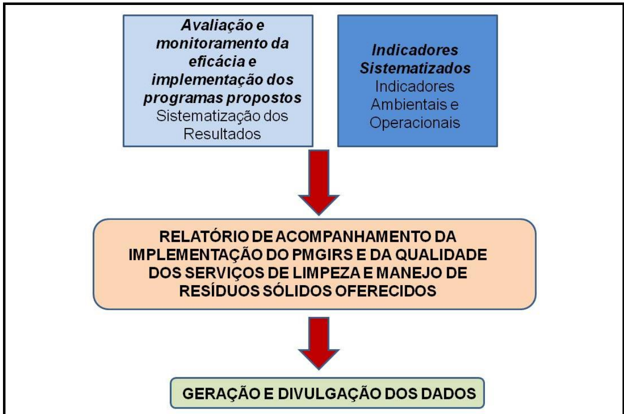
Figura 2 - Fluxograma de implementação do PMGIRS